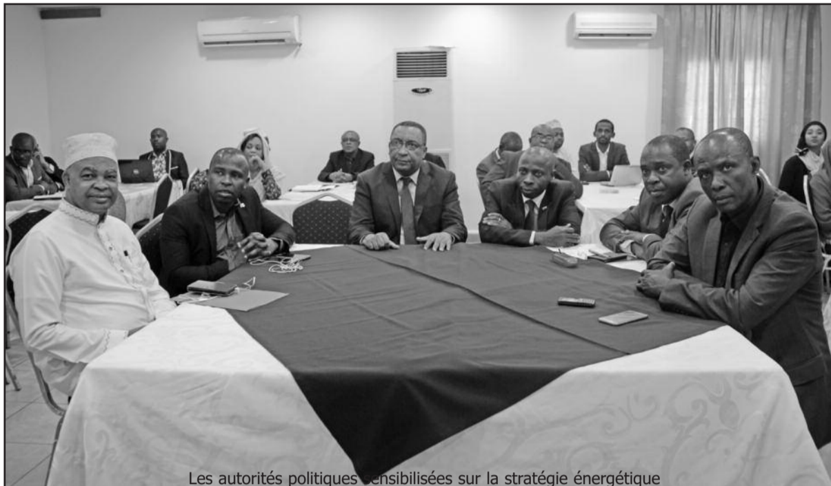
Les autorités politiques sensibilisées sur la stratégie énergétique

dans cette rencontre est d'avoir une validation de la stratégie qui va être présentée aux assises. « Nous avons travaillé avec la stratégie qui a été