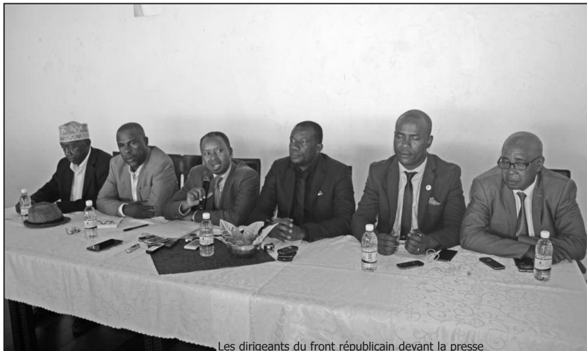
Les dirigeants du front républicain devant la presse