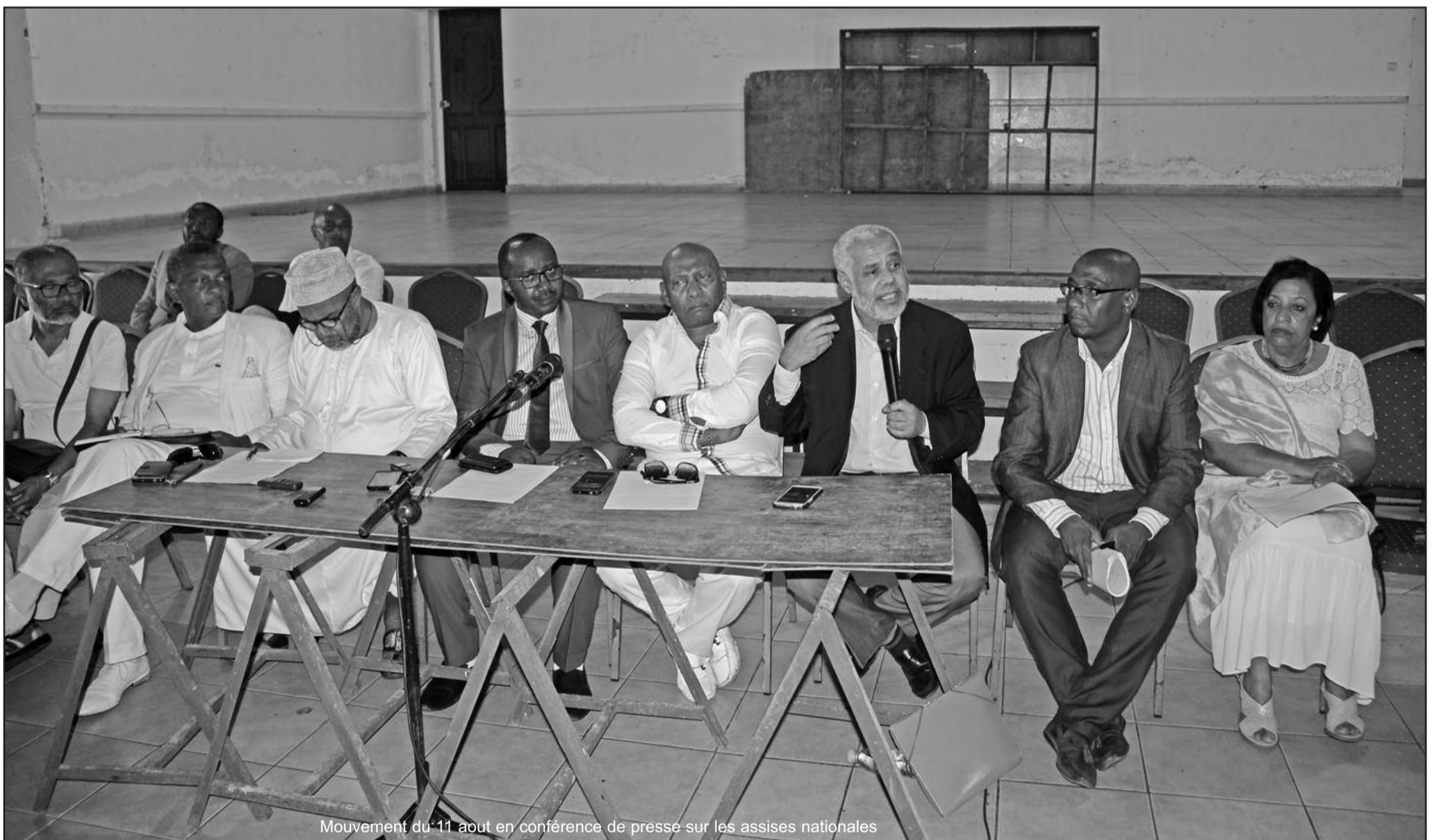
Mouvement du 11 août en conférence de presse sur les assises nationales