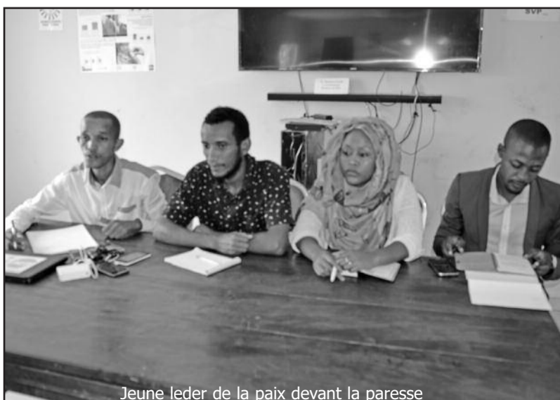
Jeune leader de la paix devant la paresse

Le Fonds des Nations Unies pour la population (FNUAP) continue à soutenir les efforts des gouvernements et de la société civile en vue de développer notre plus grand atout, les jeunes. Ils peuvent nous aider à nous rapprocher de notre vision commune d'un monde sans conflits ni violence.