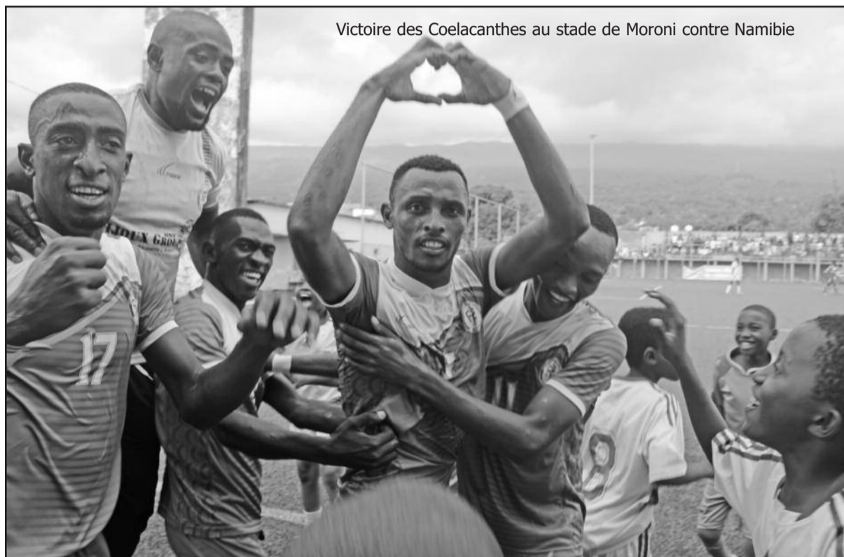
Victoire des Coelacanthes au stade de Moroni contre Namibie