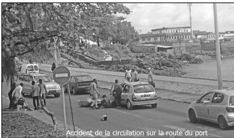
Accident de la circulation sur la route du port

Hier, un motard a violemment renversé un petit garçon d'à peine 3 ans sur le tronçon de route de Kalaweni vers le rond point Café du port. Il était exactement 12h et 45 minutes quand une mère et son enfant voulaient traverser la chaussée. Un motard qui roulait comme un éclair les a heurtés avant de terminer sa course contre un véhicule de taxi.