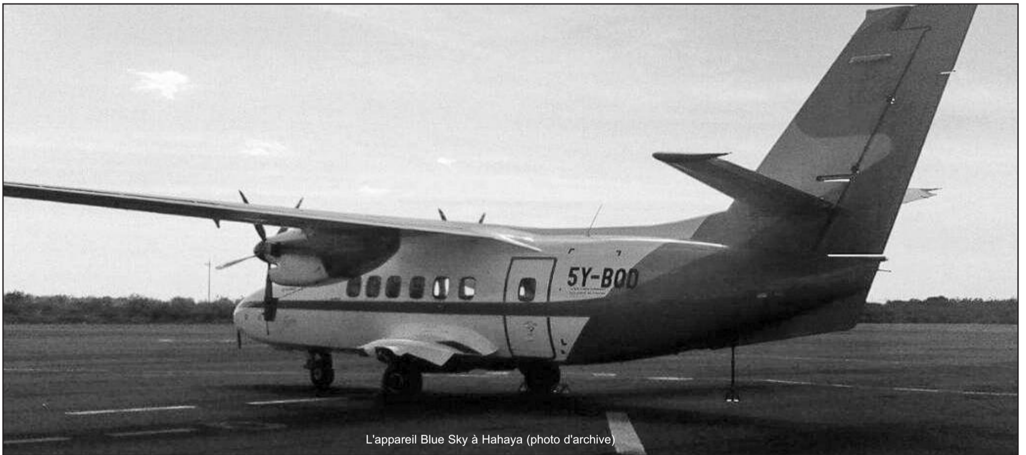
L'appareil Blue Sky à Hahaya (photo d'archive)

En catimini, l'aviation civile comorienne fait revenir le même avion appartenant à Blue Sky et banni du pays à cause de ses multiples problèmes mécaniques à l'origine