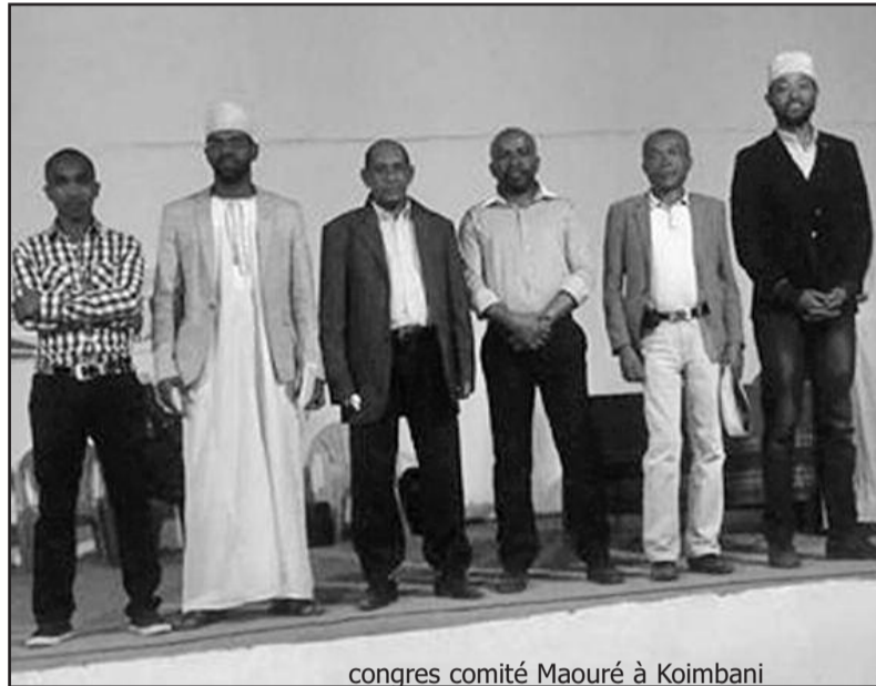
congres comité Maouré à Koimbani

« Nous n'avons pas bougé, raison pour laquelle, nous sommes