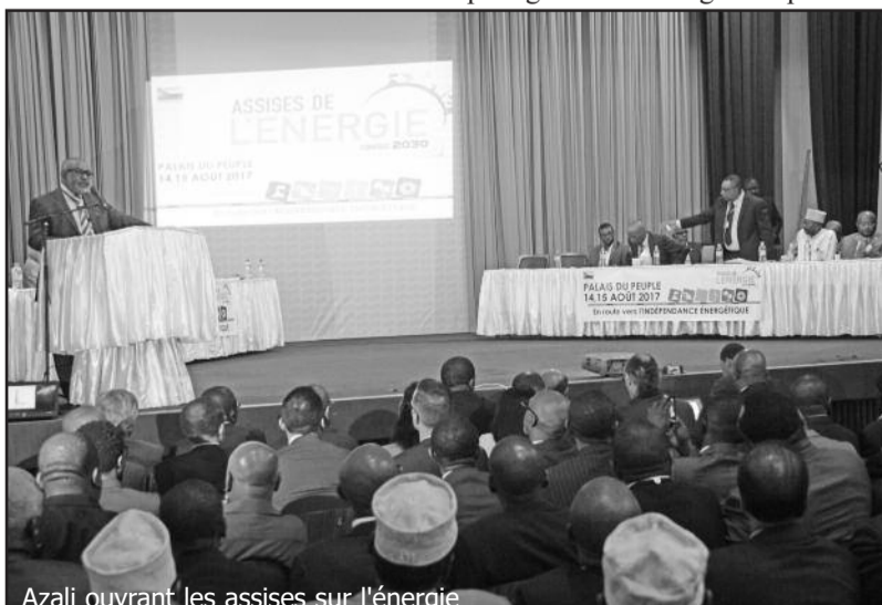
Azali ouvrant les assises sur l'énergie