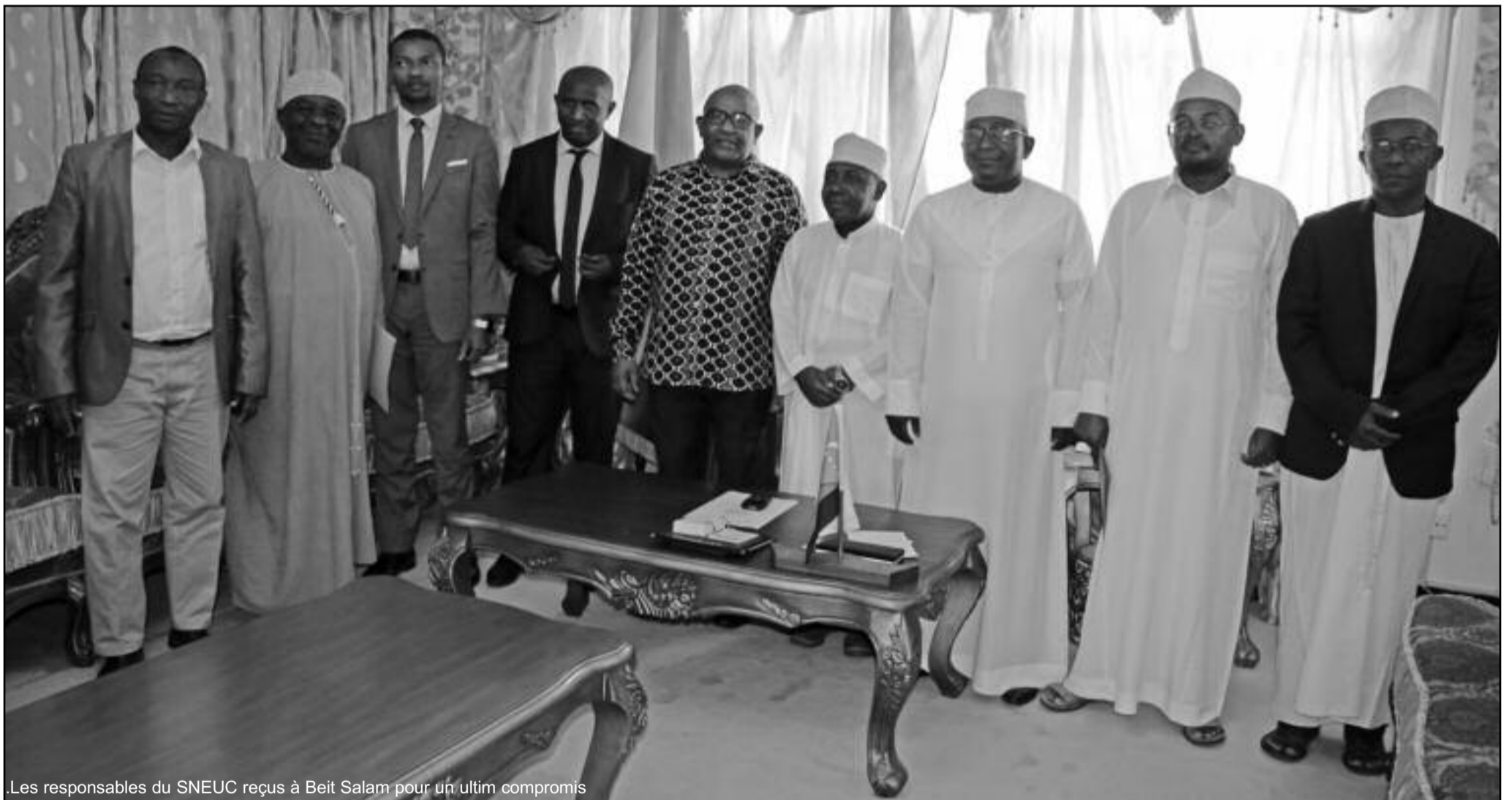
Les responsables du SNEUC reçus à Beit Salam pour un ultim compromis