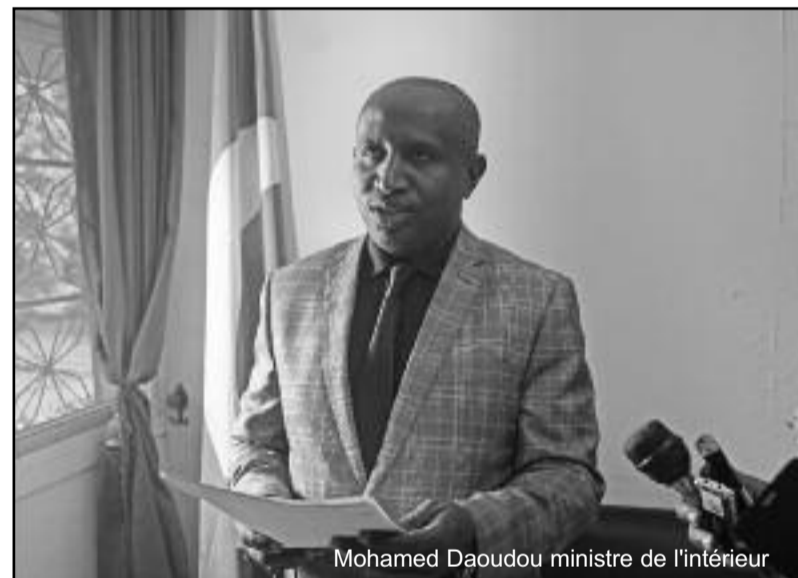
Mohamed Daoudou ministre de l'intérieur