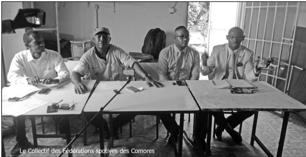
Le Collectif des Fédérations sportives des Comores

Dans une conférence de presse tenue à Moroni le mardi 27 novembre 2018, le collectif des fédérations nationales sportives a fustigé le Cosic pour sa « gestion fantaisiste et opaque du dossier financier du sport ». Au cours de ce face-à-face avec la presse, les conférenciers, une douzaine de personnes, ont présenté une feuille de route pour le reste de l'année.