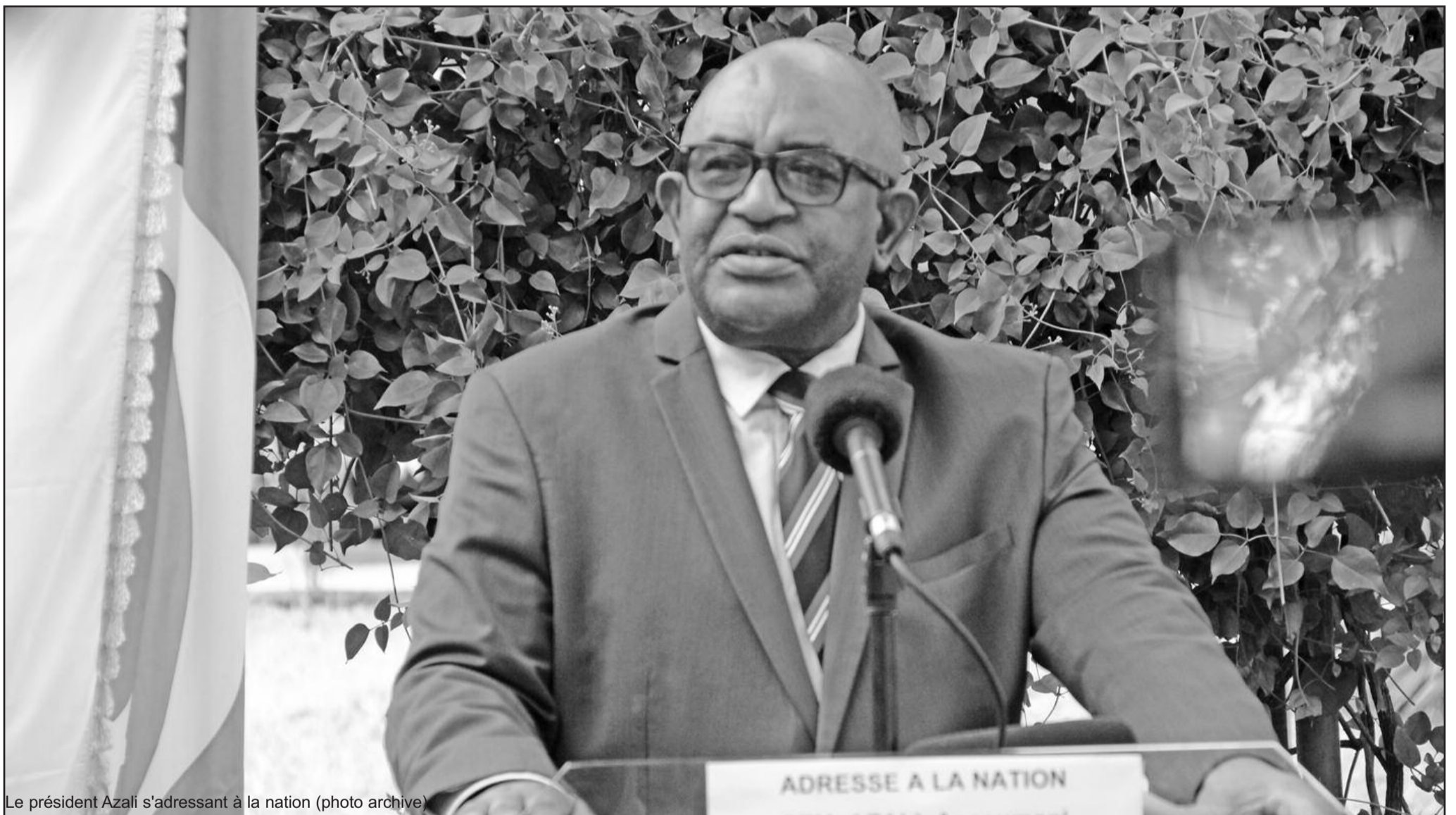
Le président Azali s'adressant à la nation