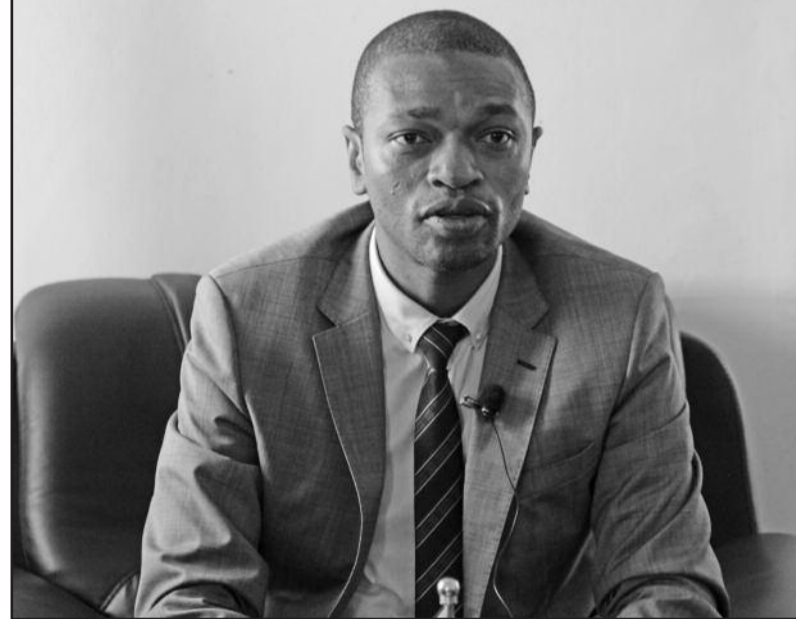
Salim Hafi ministre de l'éducation devant la presse