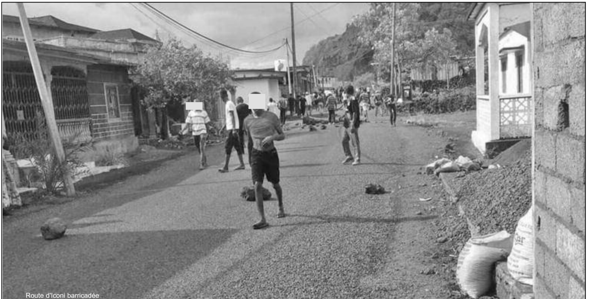
Route d'Ikonjé barricadée

Un rassemblement à Moroni pour exiger un procès rapide et équitable des prisonniers politiques