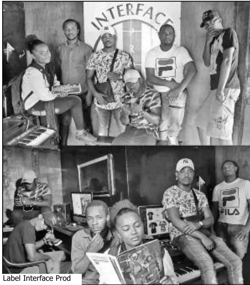
Label Interface Prod