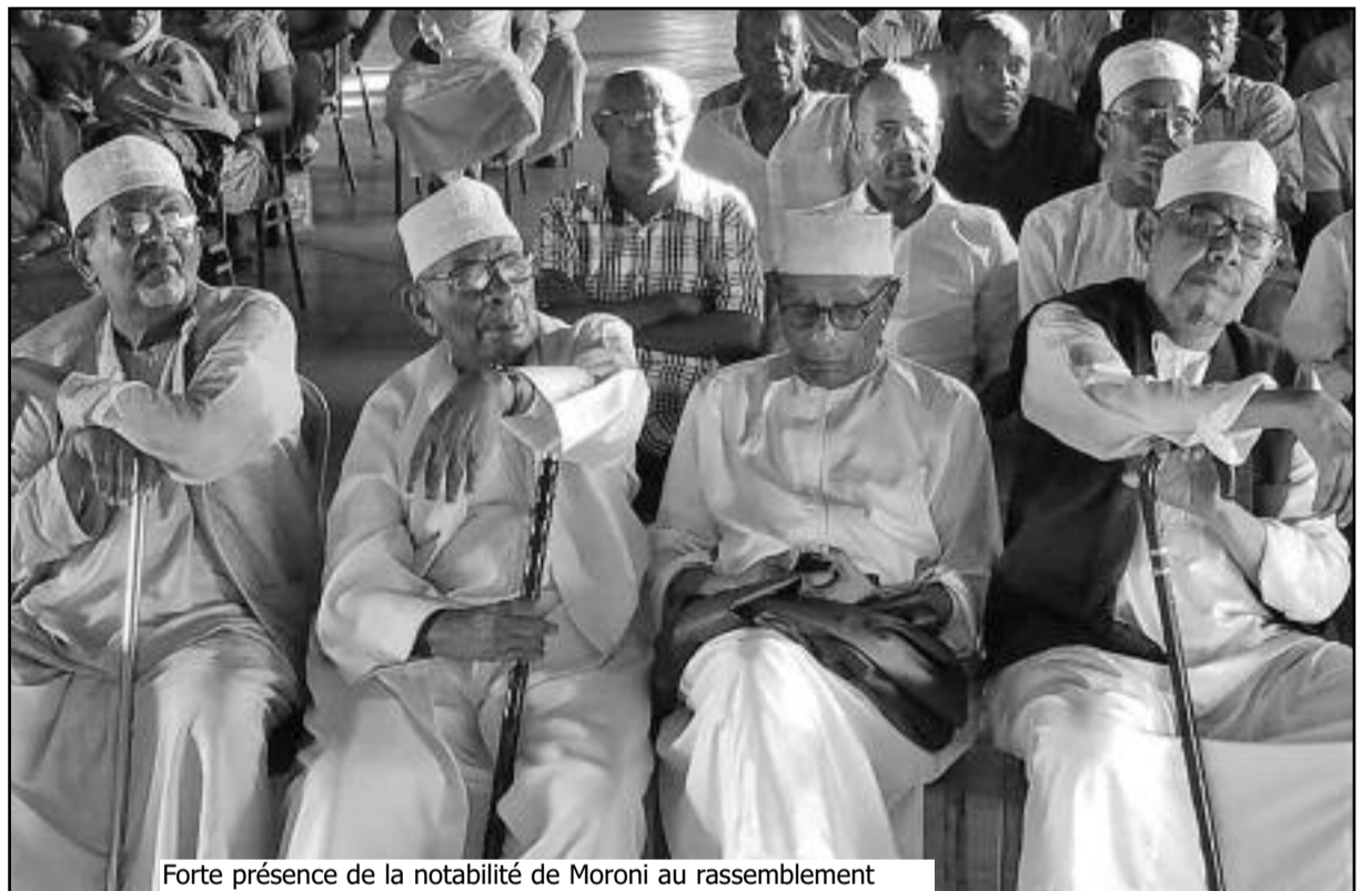
Forte présence de la notabilité de Moroni au rassemblement

Une commission a été mise en place pour assurer le suivi de ce premier rassemblement auprès des autorités compétentes, en espérant que qu'à son retour à Moroni, le président de la république prêtera une oreille attentive à ces doléances, dans un contexte politique toujours tendue, à l'approche des élections présidentielles anticipées, annoncées pour le premier trimestre 2019.