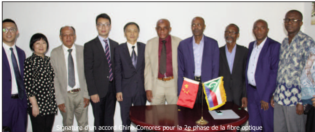
Signature d'un accord Chine-Comores pour la 2e phase de la fibre optique