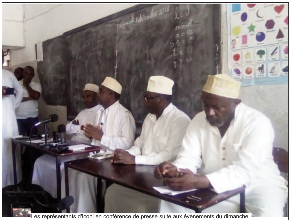
Les représentants d'Ikoni en conférence de presse suite aux événements du dimanche