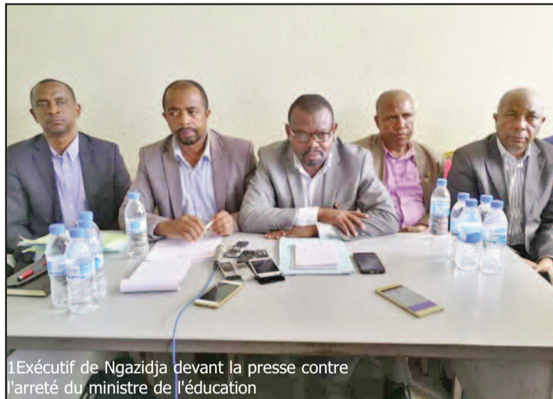
1 Exécutif de Ngazidja devant la presse contre l'arrêté du ministre de l'éducation

Revenant sur la constitution de 2018 notamment en son article 49, le commissaire explique que le ministre de l'Education Nationale a piétiné les pouvoirs du commissaire de l'île. Pour sa part, le Commissaire à la Fonction