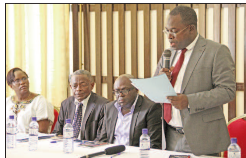
Le ministre des finances à la clôture du projet de la migration vers le Sydonia World