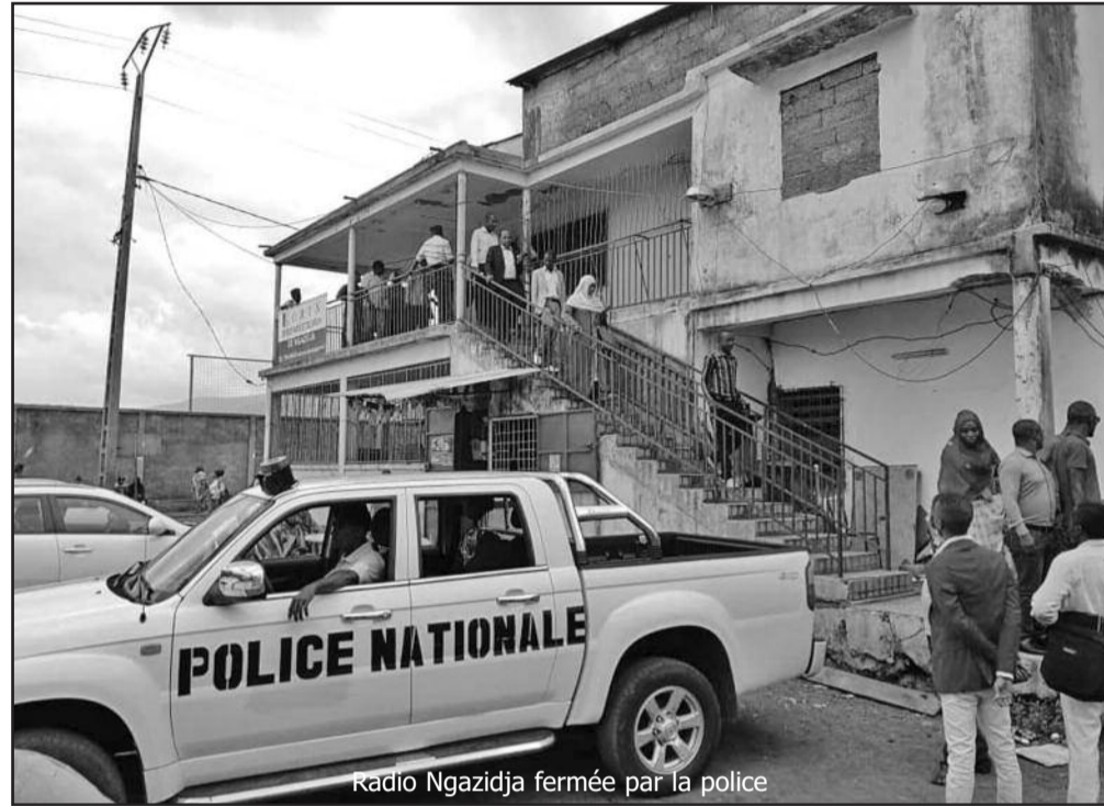
Radio Ngazidja fermée par la police