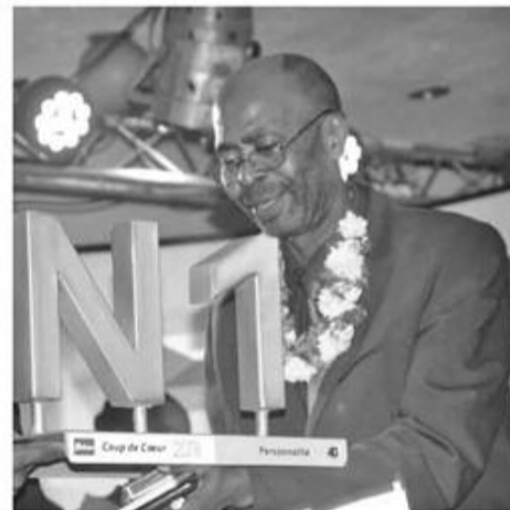
A. Saïd Sarouma Ministre des Télécoms