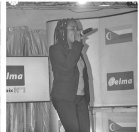
Narice Artiste Révélation 2018