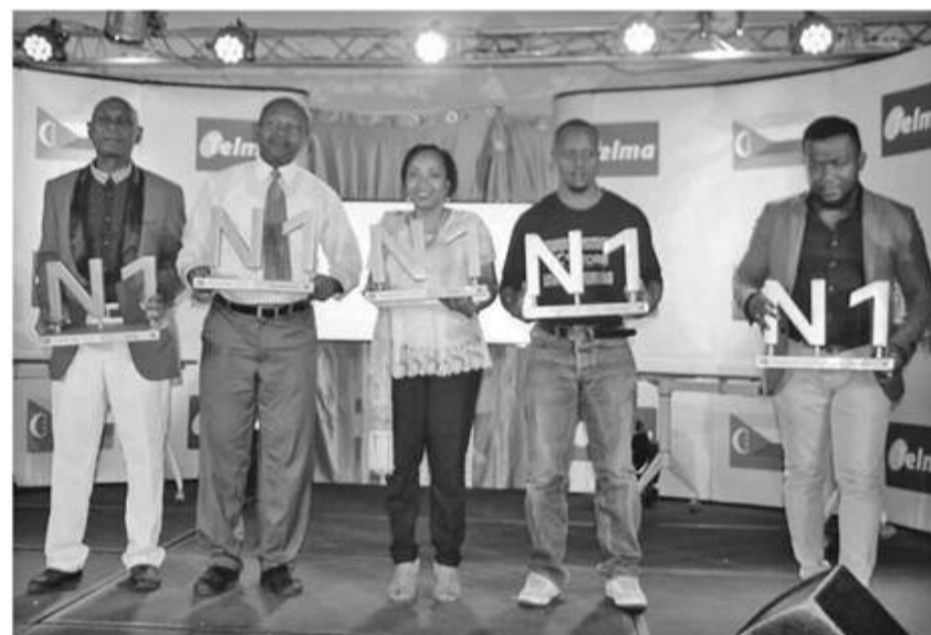
Lauréats Prix Telma N°1 2018