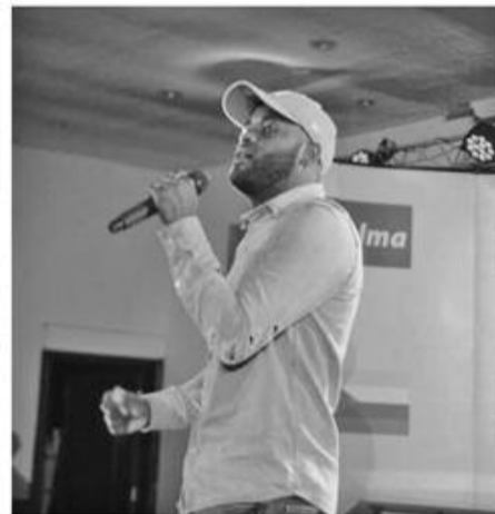
Dadiposlim Ambassadeur Telma