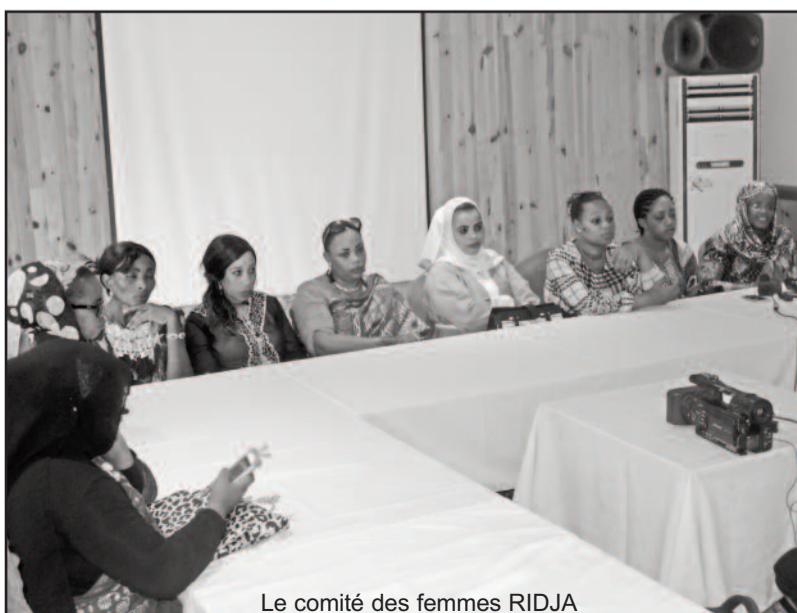
Le comité des femmes RIDJA