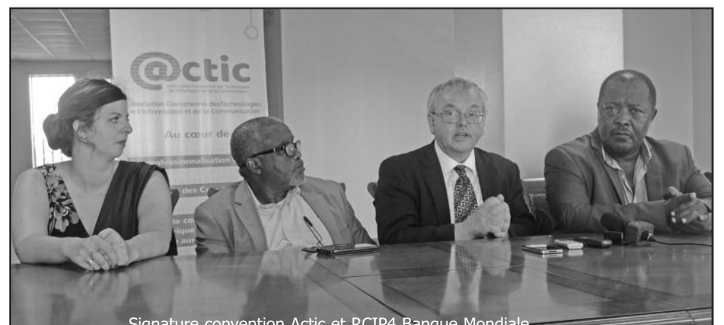
Signature convention Actic et RCPI4 Banque Mondiale