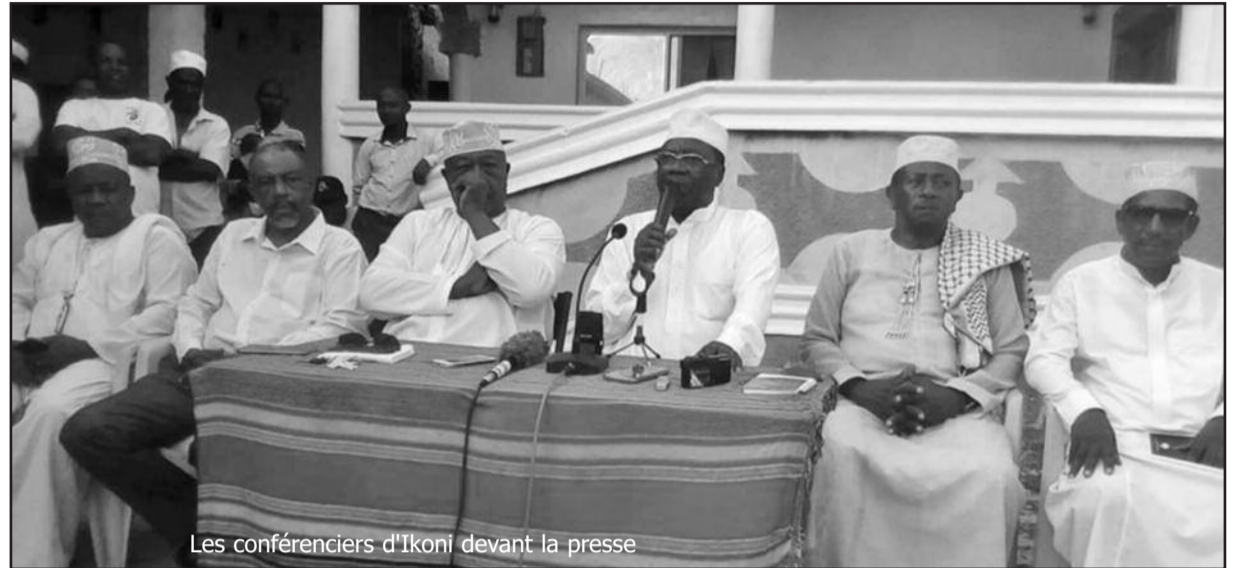
Les conférenciers d'Ikoni devant la presse

donc noté avec satisfaction que lors de ses vœux à la Nation, le chef de l'Etat a déclaré : « Je leur garantis que toute la lumière sera faite sur les causes de cette affaire, en amont et en aval. Je voudrais ainsi leur assurer qu'une réponse appropriée sera donnée par l'Etat aux responsa-