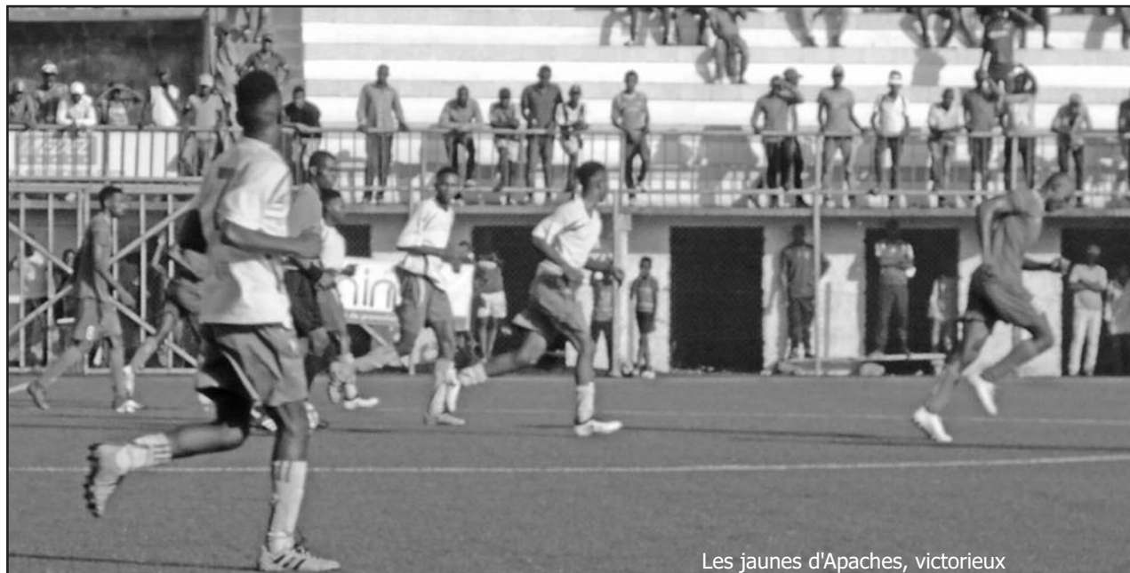
Les jaunes d'Apaches, victorieux