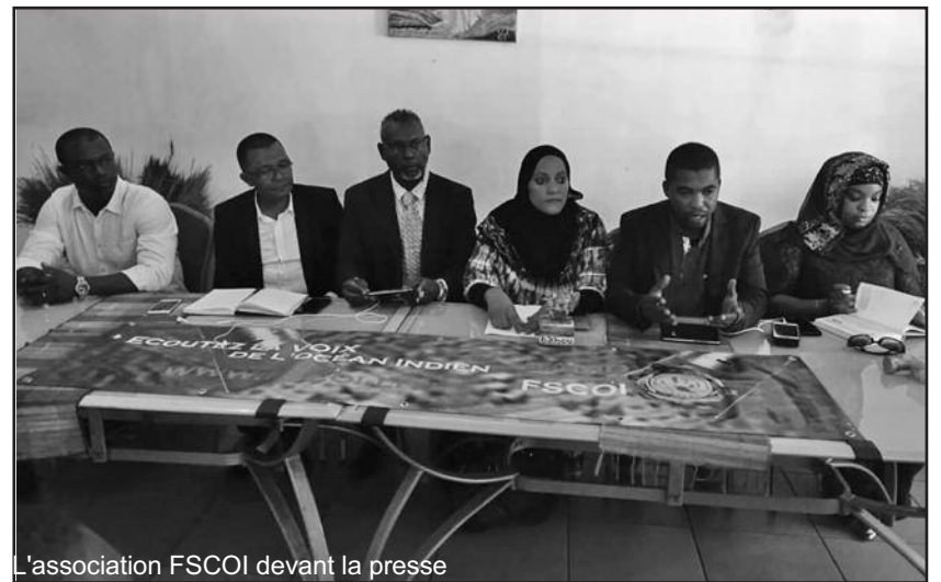
L'association FSCOI devant la presse

Tout comme le Sida, le Xeroderma pigmentosum est inguérissable, mais