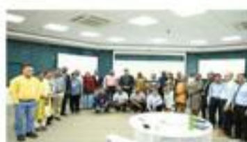
Deux fonctionnaires du Ministère des Finances des Comores ont participé au programme exécutif de IITEC à Indore, avril / mai 2024