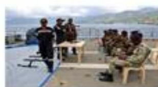
Le navire militaire indien (INS) Tarkash a fait une escale à Mut-samudu à Anjouan (Comores), octobre 2022