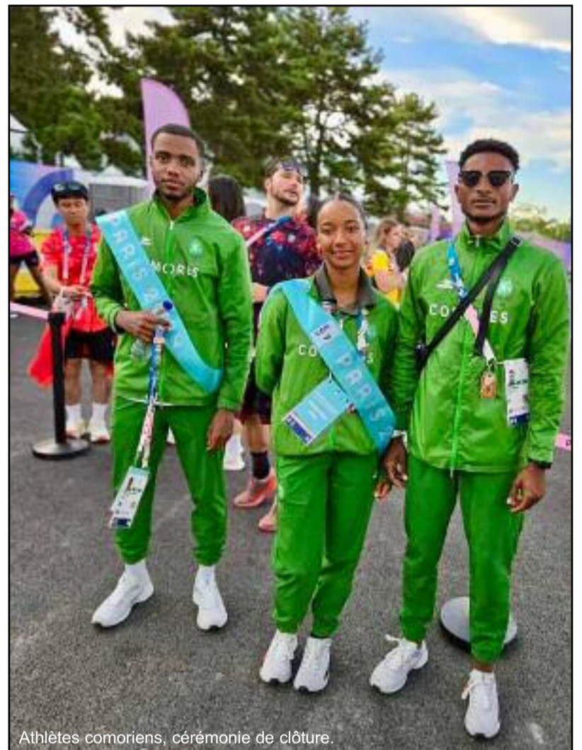
Athlètes comoriens, cérémonie de clôture.