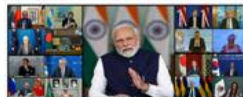
Le Président SEM Azali Assoumani a participé au Sommet virtuel du G-20, novembre 2023