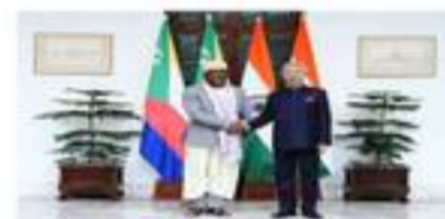
Le Ministre des Affaires Etrangères, M. Dhoir Dhoulkamal, et le Ministre des Affaires Etrangères, M. S. Jaishankar, à New Delhi pour la réunion des Ministres des Affaires Etrangères du G-20, mars 2023