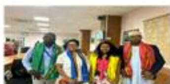
Deux journalistes des Comores ont participé à une visite de Familiarisation en Inde, décembre 2023

L'Inde offre aux Comoriens diverses formations dans le cadre du programme ITEC (Coopération Technique et Economique Indienne) et du programme de bourses d'études pour l'Afrique de l'ICCR (Conseil Indien pour les Relations Culturelles)