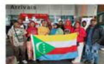
12 artistes des Comores ont participé au Surajkund International Crafts Mela à Haryana, février 2024