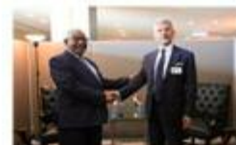
Dr. S. Jaishankar, Ministre des Affaires Extérieures, avec le Président Azali Assoumani à New York, septembre 2022