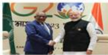
Le Président SEM Azali Assoumani avec le Premier Ministre Narendra Modi lors du sommet du G-20 à New Delhi, septembre 2023