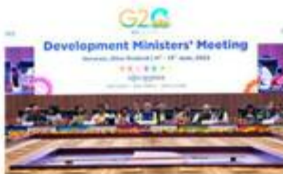
Le Ministre de l'Economie et de l'Industrie des Comores, M. Ahmed Ali Bazi, à la réunion des Ministres du développement du G-20 à Varanasi, juin 2023