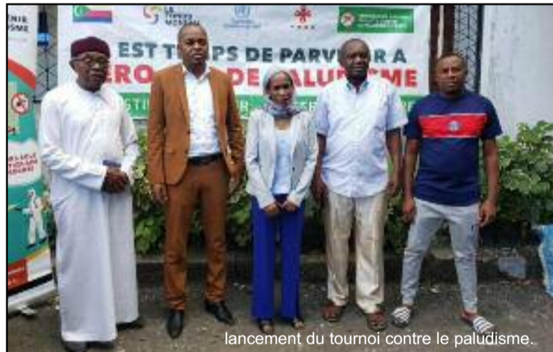
lancement du tournoi contre le paludisme.