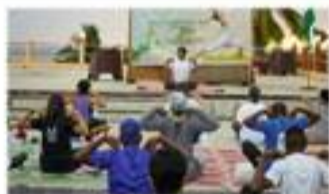
La 10e Journée Internationale du yoga a été célébrée à Moroni, juin 2024