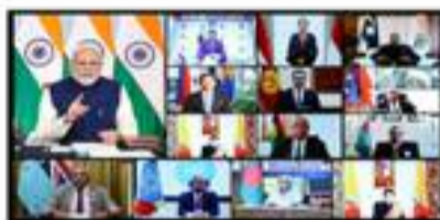
Le Président SEM Azali Assoumani a participé à la deuxième édition du Sommet "La voix du Sud mondial" en format virtuel, novembre 2023