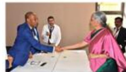
Ministre des Finances S.E. Mme Nirmla Sitharaman avec le Ministre des Finances des Comores M. Mze Abdou ohamed Chanfiou à Marrakech (Maroc), octobre 2023