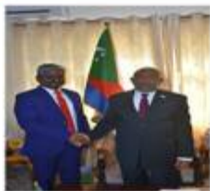
Ambassadeur Bandar Wilsonbabu à la cérémonie d'investiture du Président Azali Assoumani, mai 2024