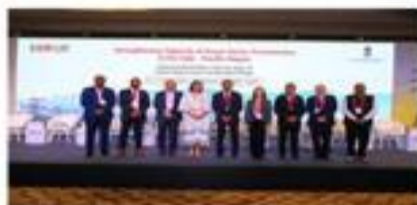
Deux hauts fonctionnaires de la Direction Générale de la sécurité civile des Comores ont participé à l'atelier du CDRI à New Delhi, juin 2024