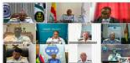
Capitaine Elmira Mohamed des Gardes-côtes comoriens aux réunions virtuelles des Chefs d'Etat-major de la Marine de la Région de l'Océan Indien (MAHASAGAR), novembre 2023 et avril 2024