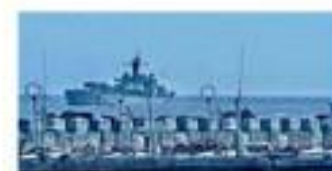
Le navire de guerre indien Kesari a visité les Comores, janvier 2022